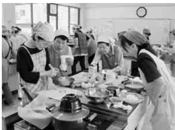
えーっと、次は何をつくりましょうか