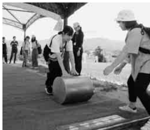
アイスクリームづくり