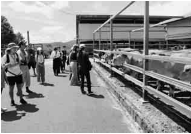
ジャージー牛に「カワイイ!!」

蒜酪育成場の牧場見学から始まりました。私たちが歓迎するかのよう集まってきた人懐っこい性格の