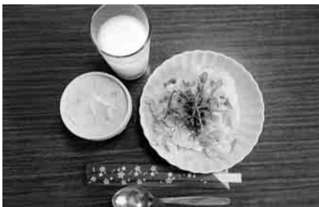
美しい乳和食3品が完成

職員が酪農家の皆さんに牛乳を使った料理を講習し、その講習会に参加された酪農家さんが一般消費者の方へ伝えていく、理想的な講習会になったと思います。「酪農家のお母ちゃんの料理教室」が各地で行われるよう、職員も勉強していきます。小さな活動ですが、酪農への理解醸成、牛乳乳製品の消費拡大へとつながれば、大変良いことだと思います。