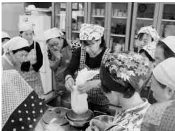
カッターチーズづくり

その後、4つのテーブルに分かれて「さけのミルクちらし寿司」など5品を調理しました。ミルクちらし寿司に使用する乳清とカッターチーズづくりから始め、皆さん手際よく次々と料理を完成させていきました。